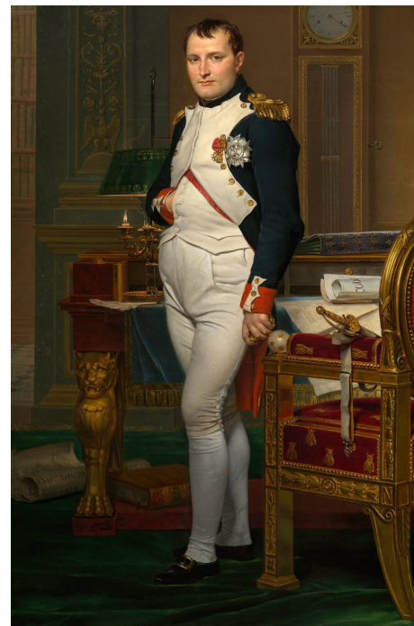
Quadro: Jacques-Louis David